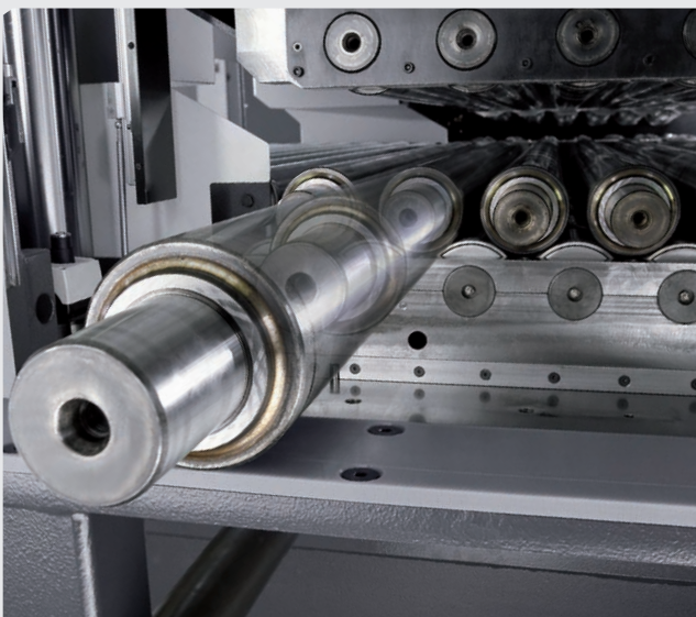
Standzeit in Wochen